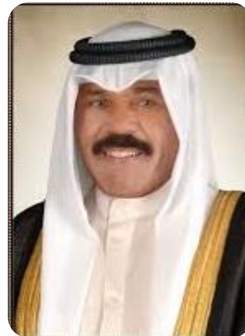
صاحب السمو الشيخ نواف الاحمد الجابر الصباح أمير دولة الكويت