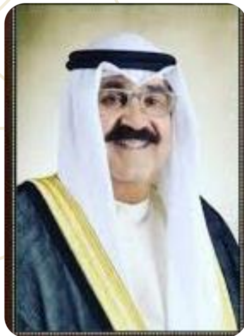
سمو الشيخ مشعل الاحمد الجابر الصباح ولي عهد دولة الكويت

إدارة التطوير والتنمية مراقبة التدريب وتنمية القوى العاملة